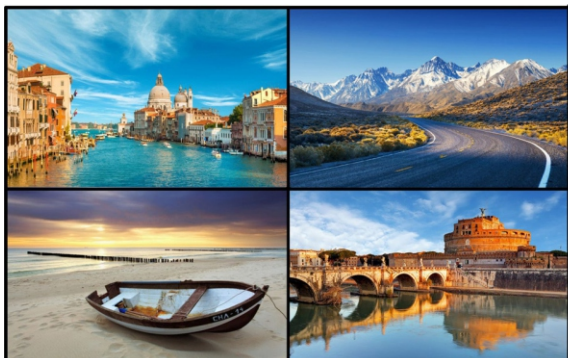
输出信号可单独选择输入信号源